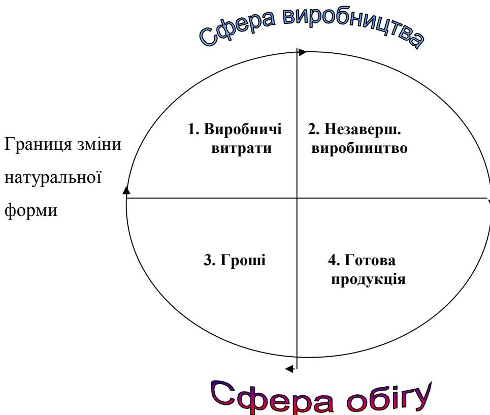
Рисунок 1. Кругообіг оборотних коштів

Розподіл оборотних коштів на оборотні виробничі фонди і фонди обігу обумовлюється особливостями їхнього використання і розподілу в сферах виробництва продукції і її реалізації.